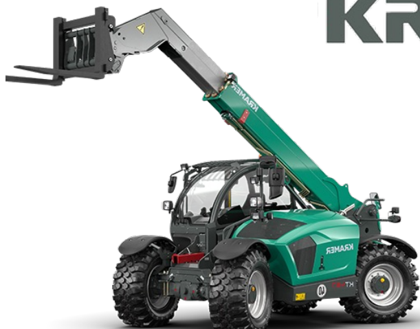
Kramer KT 6-10 meter Teleskoplastare