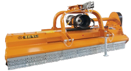
Berti Dual 300 114,900 :-