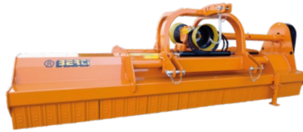
Berti EKR-S 250 68,500 :-