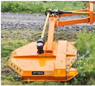
Optimal 1650 109,000:-